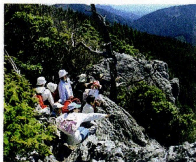
工石山登山(ヒノキ屏風岩)

利用する団体が青少年の家のルールにしたがい自主的に研修することができます。野外活動やその他について、青少年の家指導員にご相談ください。研修内容についてアドバイスいたします。